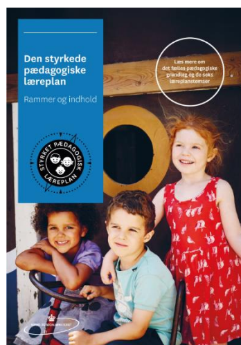
Den styrkede pædagogiske læreplan. Rammer og indhold

Inden for de krav, der følger af dagtilbudsloven, er det op til jer at beslutte, hvordan I konkret vil arbejde med den pædagogiske læreplan. Jeres læreplan skal være et dynamisk og meningsfuldt dokument, som peger fremad, og som I kan bruge aktivt i den løbende udvikling af den pædagogiske kvalitet og jeres pædagogiske praksis.